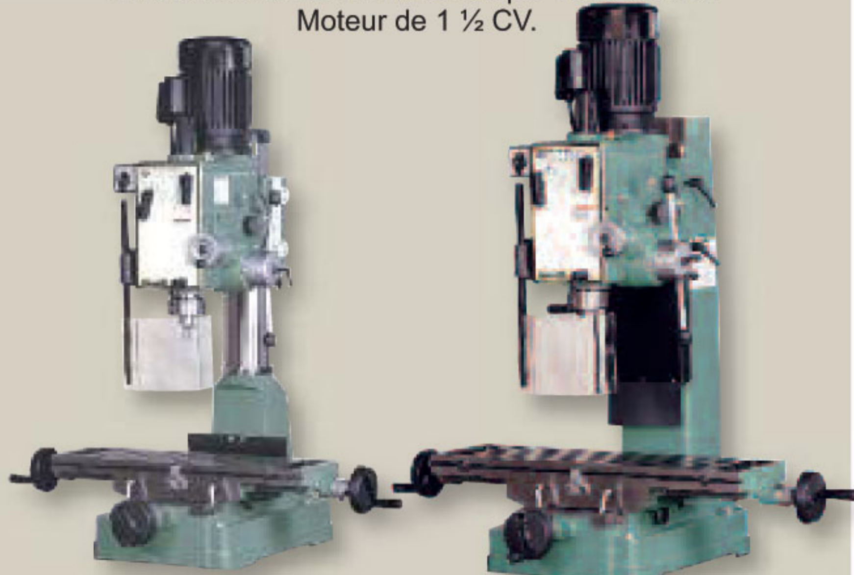
Modèle 75-875 M1

Interrupteur de marche avant / arrière. 6 vitesses de l'arbre (60, 130, 230, 450, 800 & 1500 TR/MIN.). Protecteur de mandrin inclus. Avance descendante automatique de la broche. Moteur de 1 ½ CV.